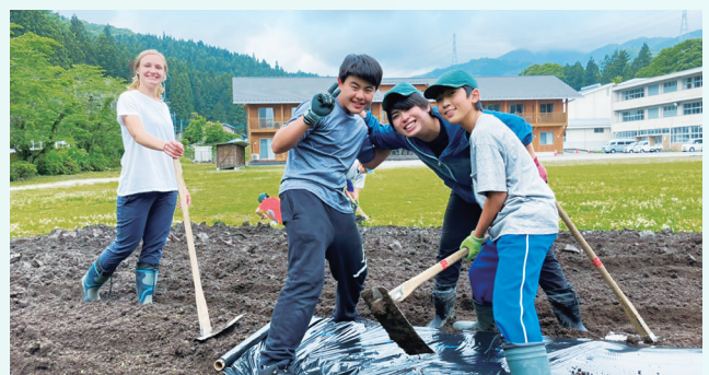
敷地内の畑を、外国人スタッフと一緒に耕す子どもたちの様子

現在、英語村では1年間の留学となる「通年コース」に加え、1泊2日の「週末コース」や3泊4日~5泊6日の「短期コース」を設け、より多くの子どもたちに体験の機会を提供しています。